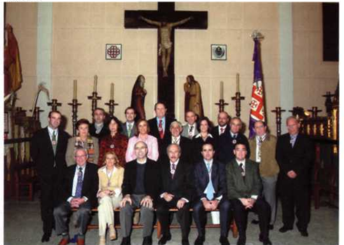
Junta de Gobierno para el periodo 2003-2005