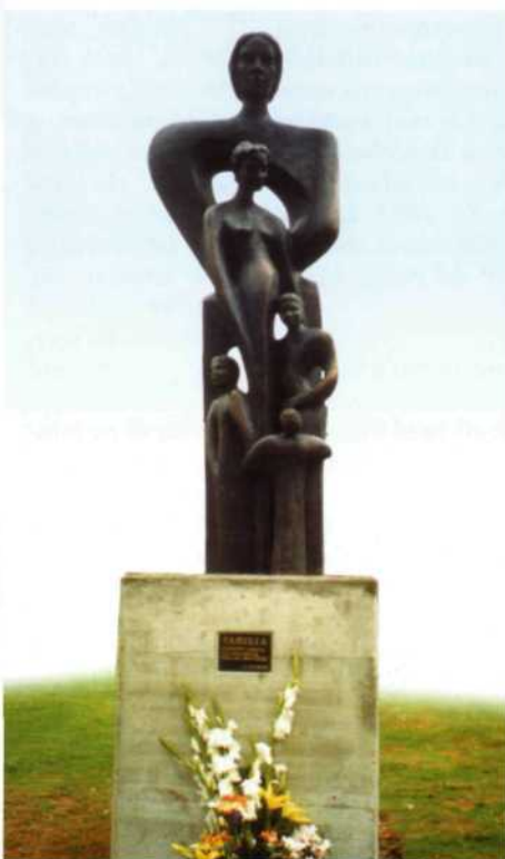
Monumento a la Familia · Escultura Henriette Boutin

En esa gimnasia espiritual tan recomendable, no sé si en el estadio de Reflexión, Meditación, Oración o Contemplación, podemos imaginar cómo sería el amor compartido en el seno de la Sagrada Familia, compatible con los papeles que en el componente humano de la Familia correspondería a cada uno de sus miembros. El Hijo, con ese papel central en la Historia de la Humanidad y modesto en la sociedad aldeana de un pueblo galileo; la Madre, viendo a un hijo de verdad que sabe tiene una misión sublime que cumplir; el patriarca más que padre a secas, trabajando de artesano, cerrando sus ojos y resignando su corazón a todo lo que le había tocado en suerte.