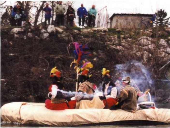
Por el río Arga llegada de los Reyes Magos a Pamplona.