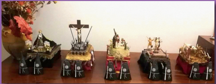
Arriba: La Dolorosa junto a la bandera de la Hermandad y san Fermín durante el Septenario. Sobre estas líneas: Recreaciones de pasos realizadas por niños.

días para llegar a todo el mundo en sus domicilios.