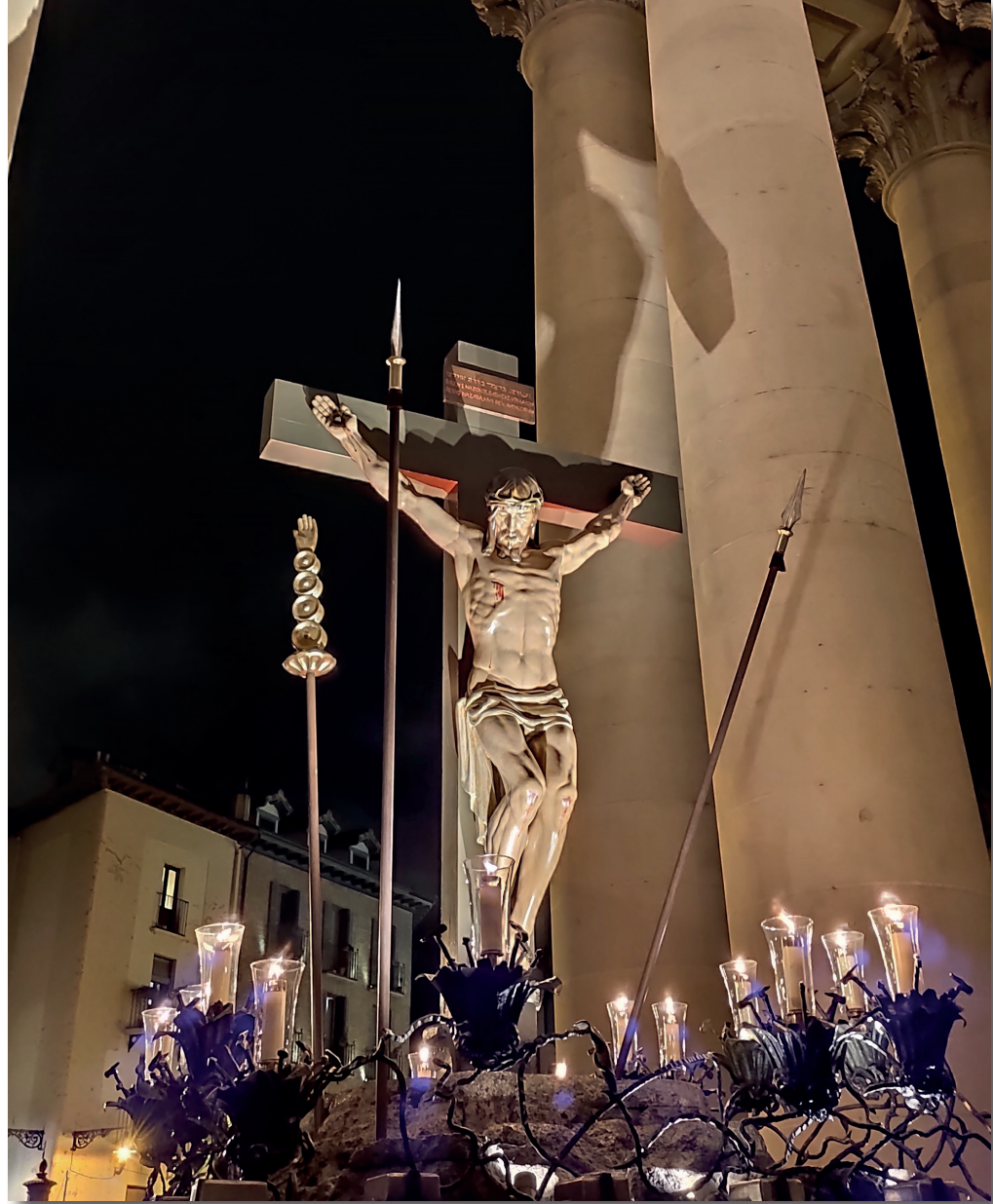
El Cristo Alzado entrando en la Catedral el año pasado. No volvería a salir.

Durante estos meses Él ha seguido desde sus andas el devenir de estos tiempos oscuros. ha visto celebraciones con limitación de aforo, ha escuchado rezos a sus pies, a los pies