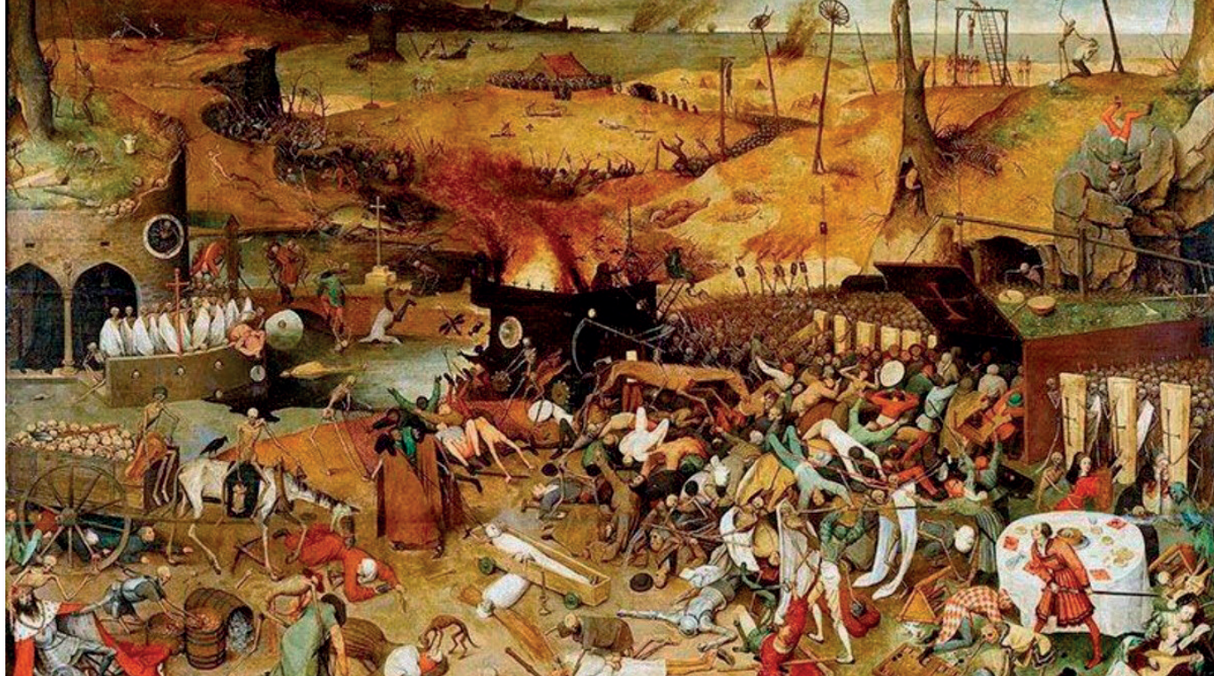
“El triunfo de la Muerte” de Pieter Brueghel.

ve claramente que el diluvio tiene un carácter universal y penal. Es un castigo que Dios inflige por los pecados ¡tantos! de la humanidad. Al menos el episodio acaba bien: Una vez finalizado el castigo Dios establece nueva alianza con la familia de Noé y promete que no volverá a repetirse algo semejante. El arco en el cielo que aparece en las tormentas es signo de la promesa divina (Gn 9,12) ¡qué misterio que en nuestra secularizada sociedad el símbolo del arco iris se haya puesto de nuevo en tantas ventanas con dibujos de niños, junto al mensaje de “Todo va a salir bien”! ¿Serán conscientes de las profundas raíces bíblicas de este símbolo?