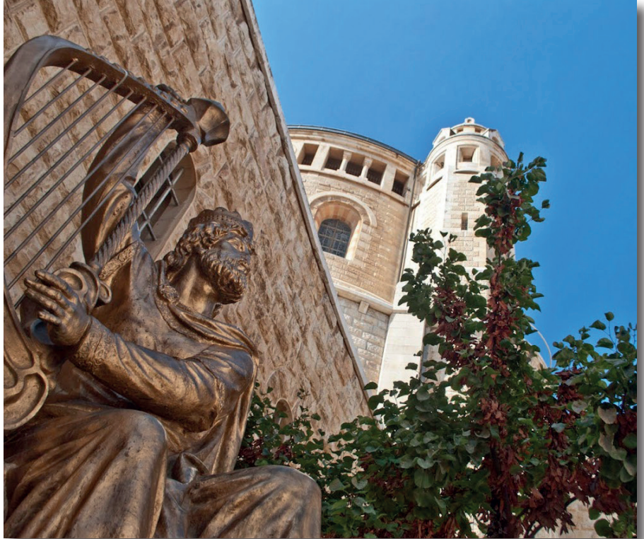
Estatua del rey David en Jerusalen.

Así parece que lo entendió también san Pablo , cuando advertía a los Corintios “no quiero que ignoreis hermanos que nuestros padres... la mayoría no agradaron a Dios, pues sus cuerpos quedaron tendidos en el desierto. Estas cosas sucedieron en figura para nosotros, para que no codiciemos el mal como lo codiciaron ellos. Y para que no seamos idólatras como algunos de ellos. Y para que no fornicemos, como fornicaron algunos de ellos, y cayeron en un solo día 23.000. Y para que no tentemos a Cristo, como lo tentaron ellos y murieron mordidos por las serpientes. Y para que no murmuréis, como murmuraron algunos de ellos, y perecieron a manos del Exterminador. Todo esto les sucedía alegóricamente y fue escrito para