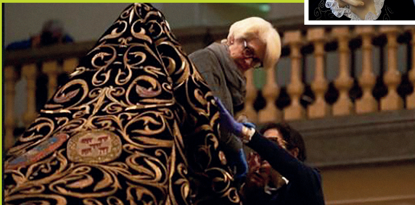
Arriba a la dcha.: Nuestra Madre de Pamplona. Sobre estas líneas: Proceso de vestido de la Dolorosa por las hermanas de la comisión.

La Comisión de Hermanas está compuesta por las miembros femeninas de la Junta de Gobierno.