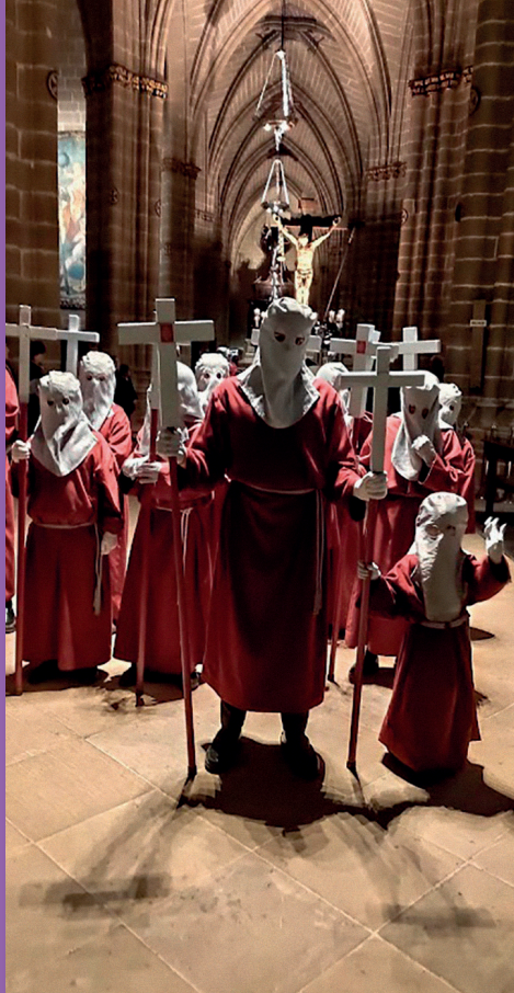
El último Vía Crucis que se celebró con normalidad