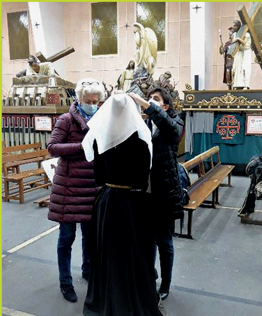
La otra Dolorosa que tenemos en la Hermandad

que se han ido comprometiendo a asistir con regularidad.