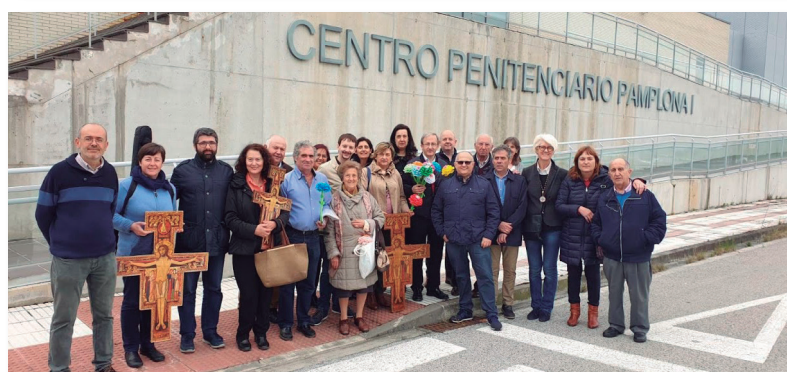
De arriba a abajo: 1. Vía Crucis de Cuaresma en la Catedral. 2. Vía Crucis en la Meca. 3. Vía Crucis con la Pastoral Penitenciaria.

pues muchas hermanas acuden negro e incluso con mantilla, pero todas con el corazón rendido y abierto al consuelo que Ella siempre nos da y que nos ayuda a nosotras a dar también.