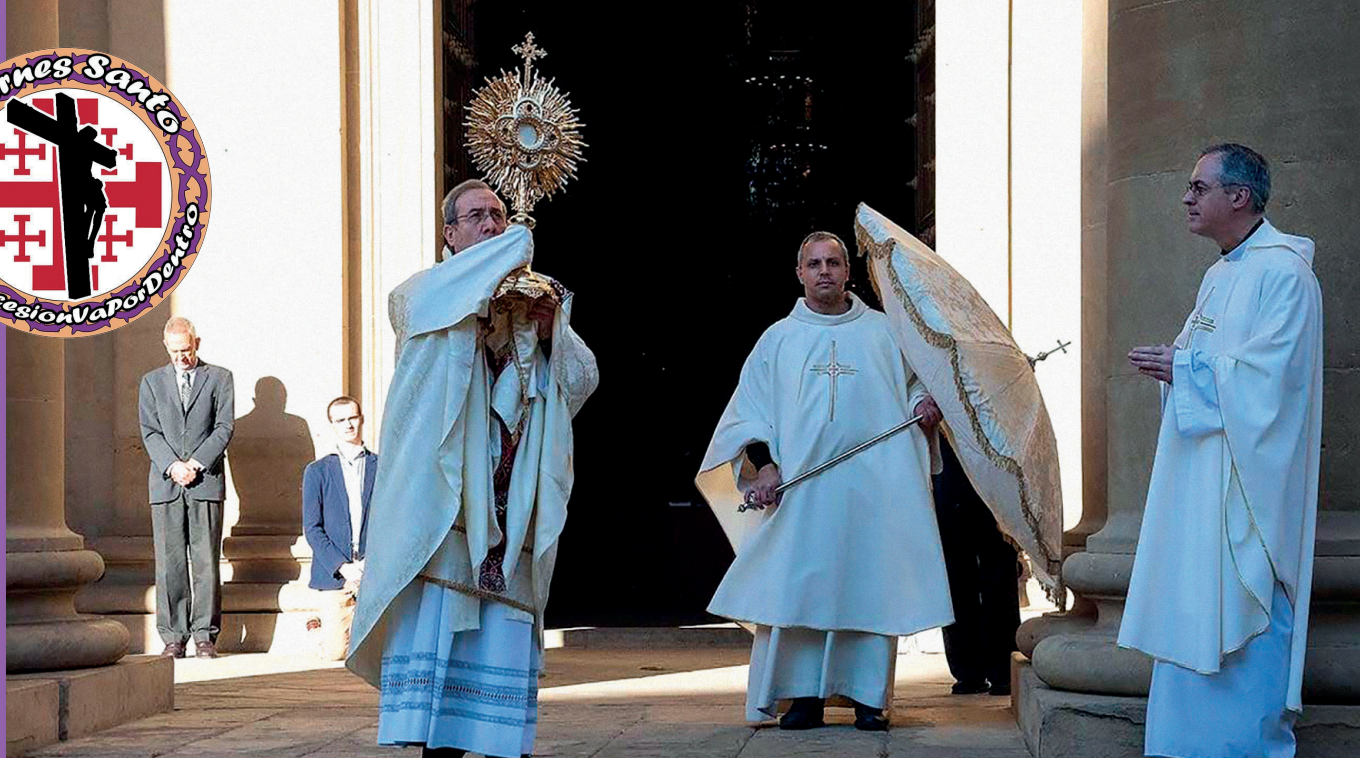
El arzobispo bendice la ciudad durante el Jueves Santo.