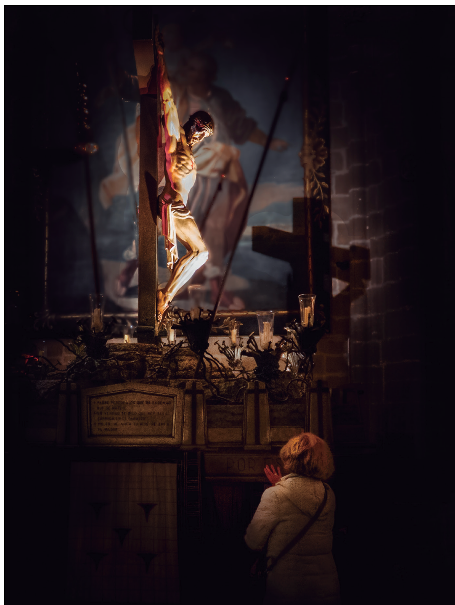
El Cristo alzado en la Catedral desde el Miércoles de Ceniza de 2020.