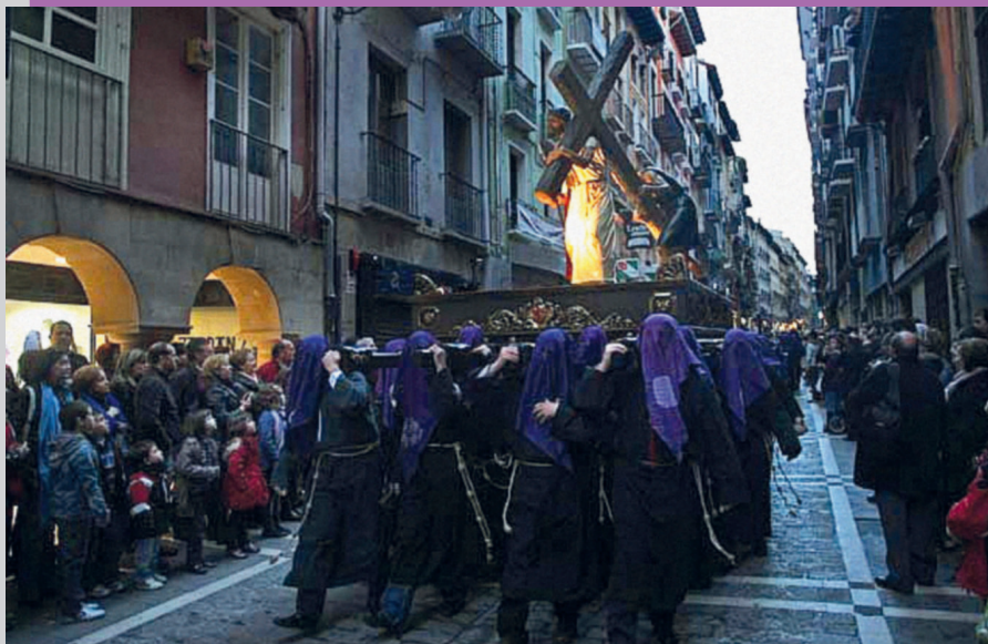
Cristo sigue necesitando cirineos que lo saquen a la calle

Dos mil años después los mensajes evangélicos siguen resonando entre nosotros. Nos invitan a que aunemos tradición, privilegio y sacrificio para ser portadores de pasos. Como decía un eslogan deportivo de hace unos años, “Contamos contigo”. En la Hermandad también contamos contigo, te necesitamos a ti y a todos aquellos que puedas traer para llevar a cabo esta ancestral tradición de mostrar por las calles de nuestra ciudad los pasos que escenifican la Pasión y que, como he señalado, es un privilegio que también supone un sacrificio físico.