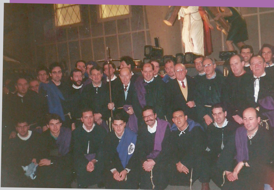
Grupo intergeneracional de portadores ante su paso

En la actualidad se ha perdido aquel ambiente que presidía la Semana Santa, en la que no había otra cosa que hacer sino acudir a la centenaria tradición de los santos oficios y a la procesión posterior, dado que entonces no se podía escuchar música, ni ir al cine, ni realizar otras actividades que ahora son corrientes y habituales. La situación ha cambiado y cada vez hay más oportunidad de salir de vacaciones o de realizar un viaje, añadidos a ciertos desapegos que provocan pérdidas o enquistamientos de tradiciones ancestrales. Por ello cobra relevancia el