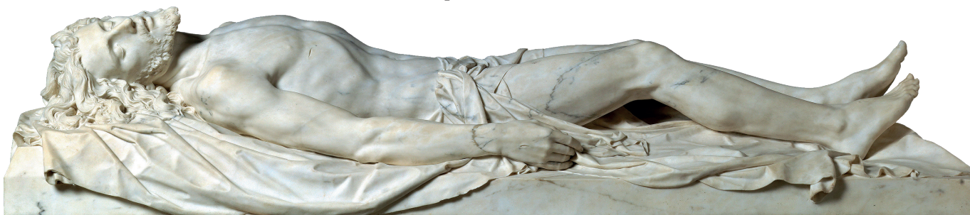
Cristo Yacente. Museo del Prado.

Para este Yacente realizó varios ensayos, modelos en terracota, en los que prueba representar al cuerpo muerto de Cristo más o menos cubierto con el sudario y en posturas algo distintas. Se conservan en los museos Mares y Nacional de Arte de Cataluña de Barcelona y otra en el comercio actual de arte. Además, realizó otra versión, en