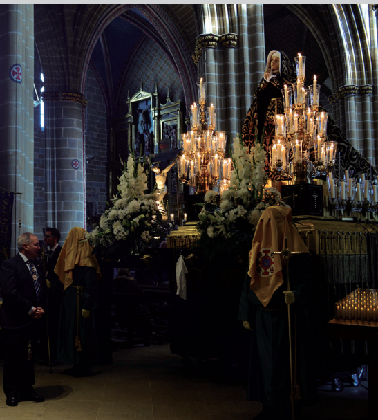
Fotografía de Silvia Ollo Casas, "Via Crucis".

Santa Iglesia Catedral de Pamplona, 20 h.