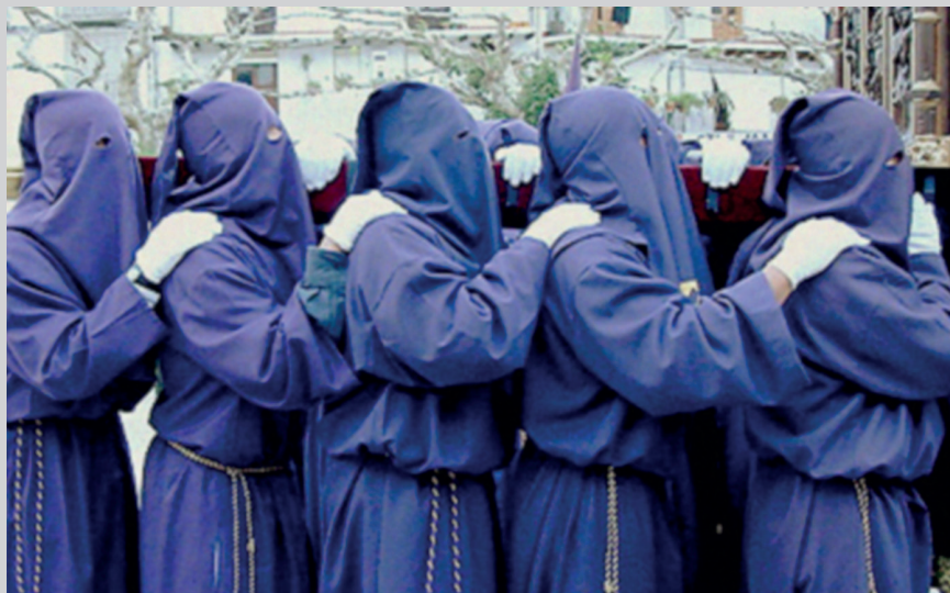
Un ejemplo de higiene postural al llevar un paso

mera acción de portar, extensiva hoy a quien quiera. Simplemente basta con desearlo, ser de la Hermandad y solicitarlo oportunamente. A nadie se le niega la oportunidad; al contrario, se le acoge con los brazos abiertos.