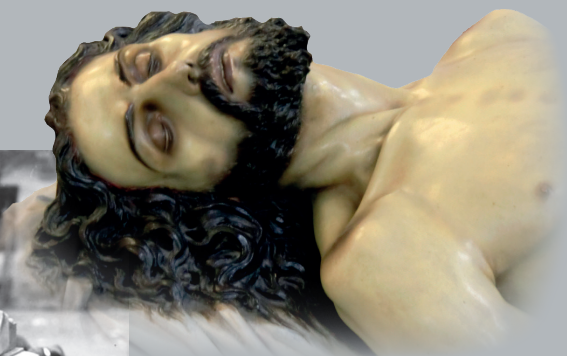
Cabeza de Cristo del paso del Sepulcro de Pamplona.