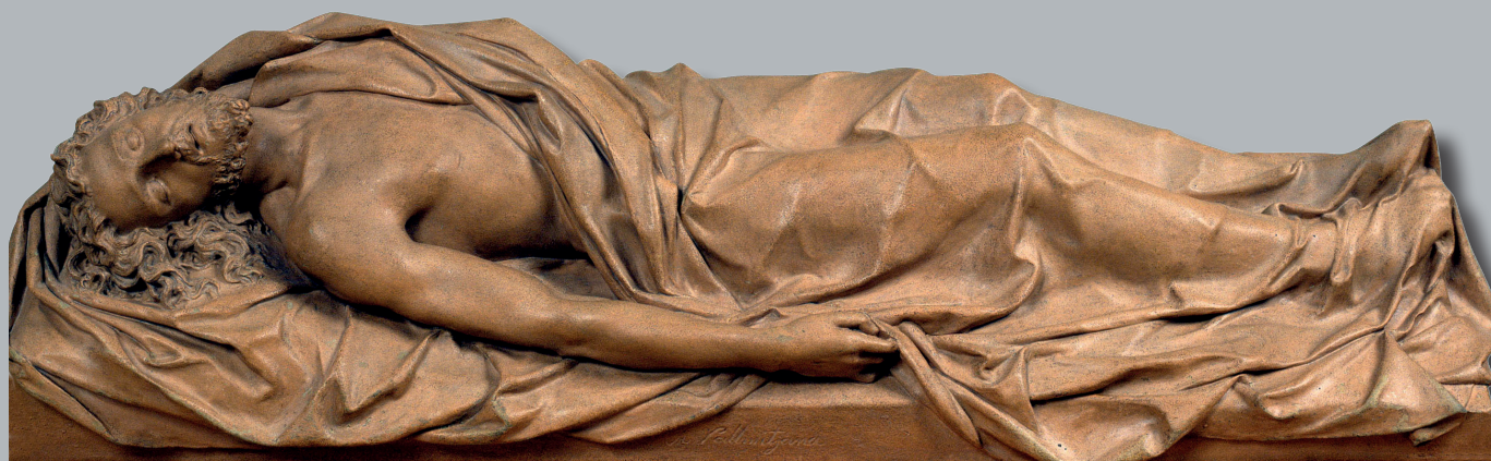
Modelo de Cristo Yacente en terracota. Museo de Arte de Cataluña.

mármol, para el panteón del marqués de Comillas.