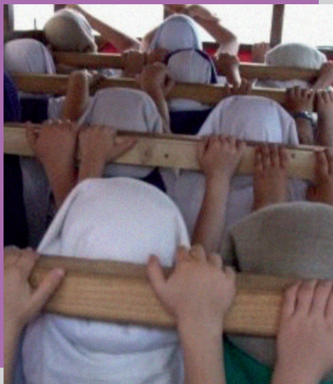
Ensayo de costaleros