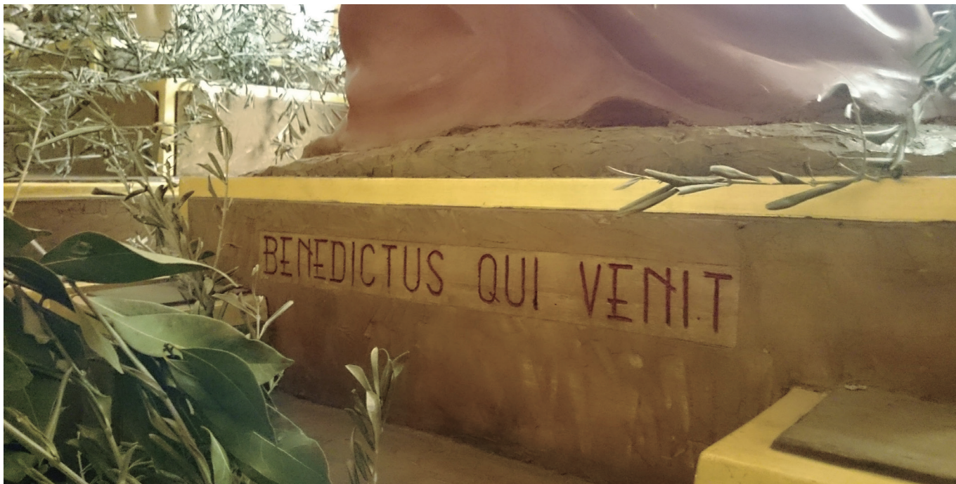
Inscripción de las andas

lando las mismas hasta darles la forma del propio Monte de los Olivos. En efecto, mediante esas típicas formas geométricas que podemos ver en las fachadas de sus edificios, recrea la misma falda rocosa del monte de una forma casi cubista. Logra así que sea el mismísimo Monte de los Olivos el que pasee por nuestras calles portando a Cristo en alabanza.