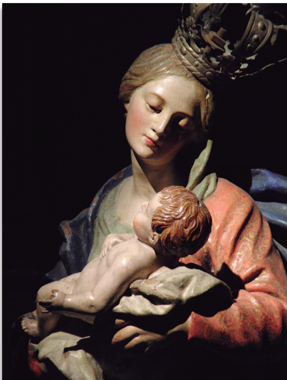
Virgen de Belén (Catedral nueva de Salamanca), atribuida a Luisa Roldán