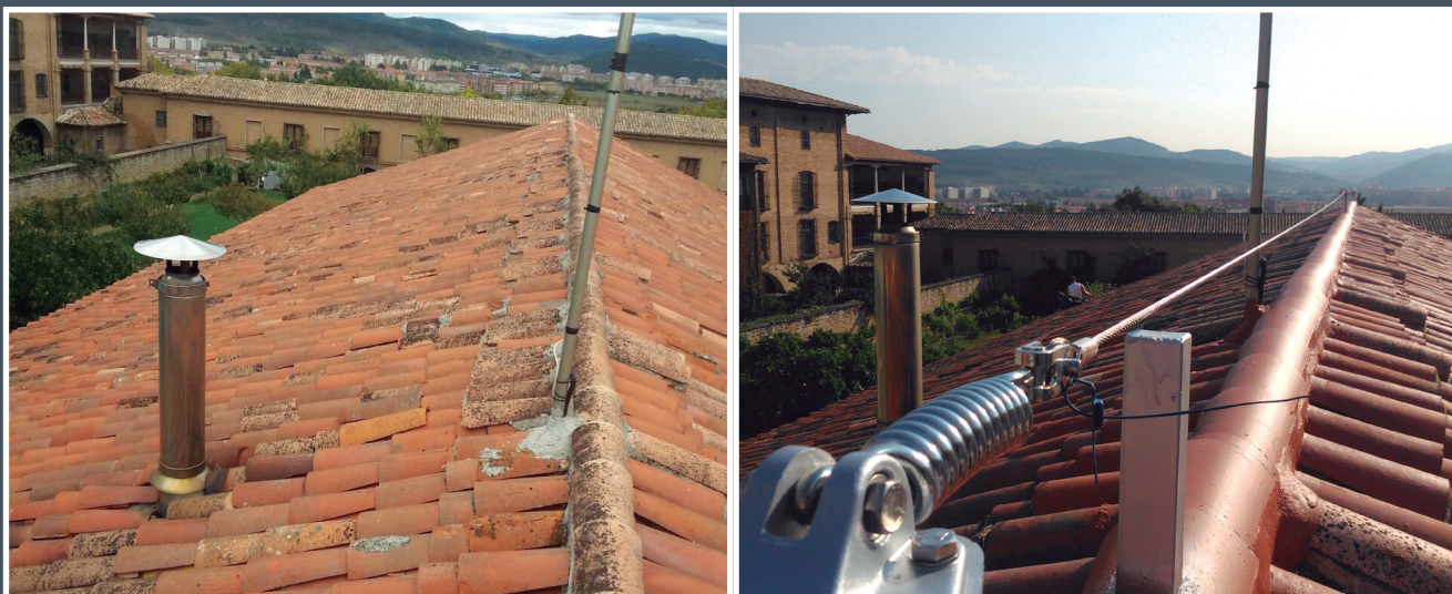
Vista del tejado antes y después de las obras

(con derecho a deducción fiscal por el Mecna)