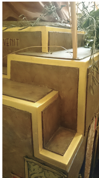
Diversos aspectos de las andas