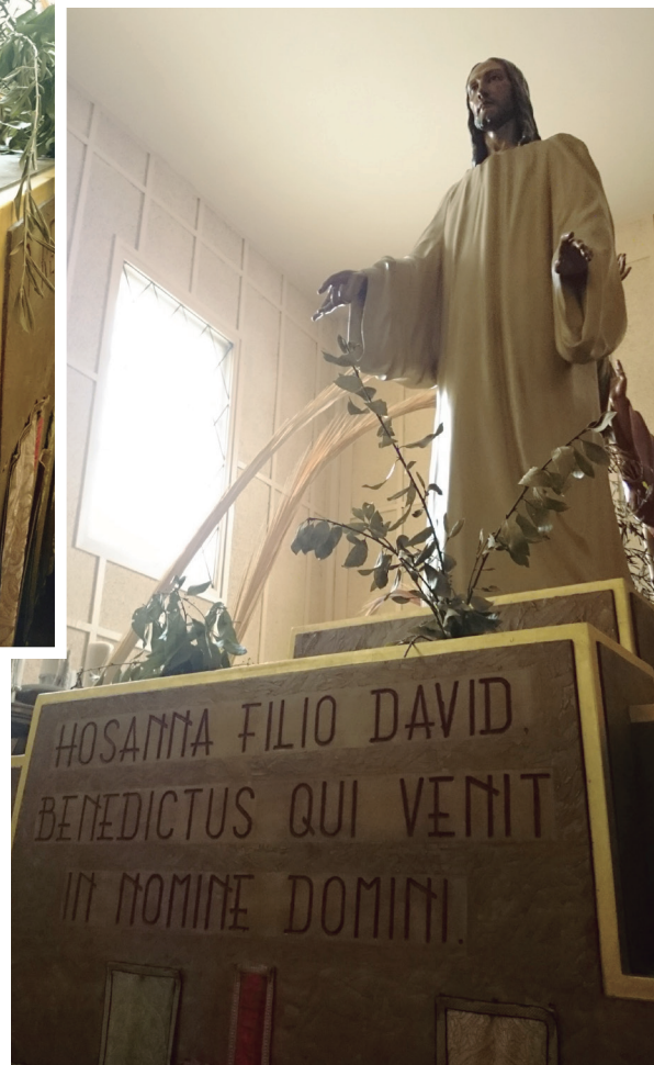
Inscripción de las andas

con motivo del 125 aniversario de la Hermandad.