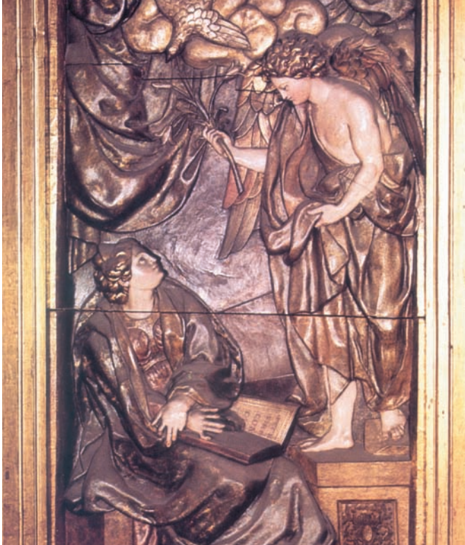
Anunciación. Pedro Glez. de San Pedro. 1.598 · Retablo de San Miguel. Pamplona