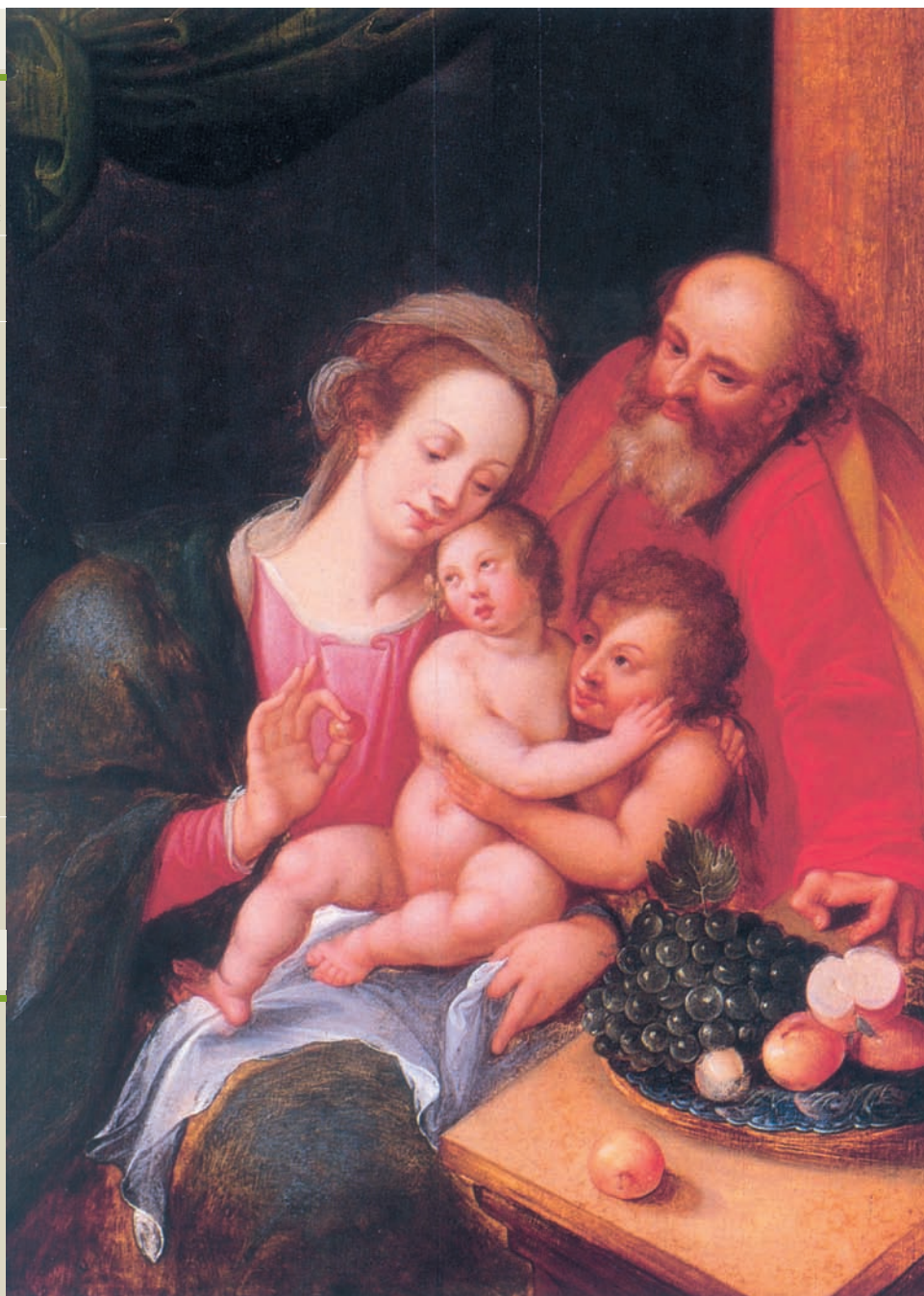
Sagrada Familia con San Juan Bautista. S.XVI.