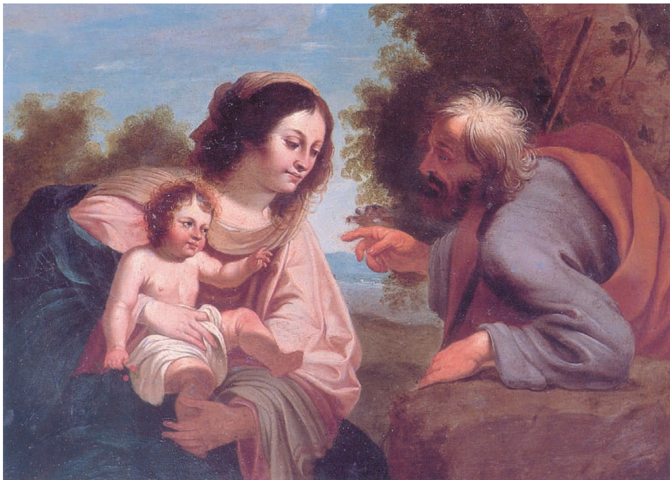
Sagrada Familia. S XVIII. Recoletas. Pamplona.

Introducción y Selección Fernando Martín Cristóbal.