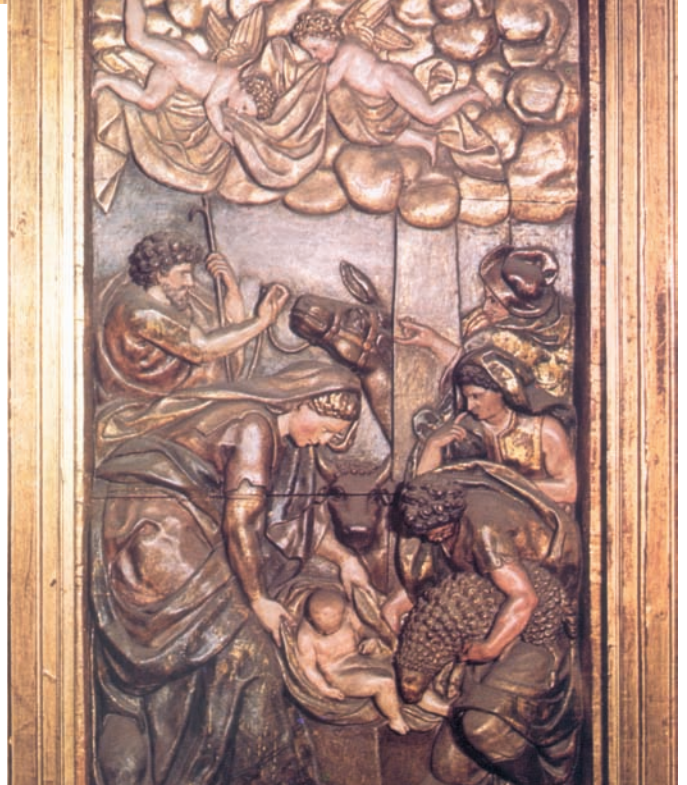
Nacimiento. Pedro Glez. de San Pedro. 1.598 · Retablo de San Miguel. Pamplona