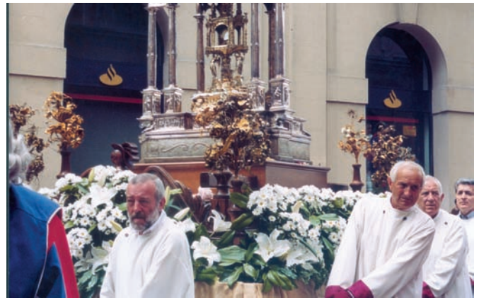
Procesión Corpus Christie 2005.

■ En la Procesión del Corpus, la Asociación de Amigos de la Catedral recuperó la utilización de la carroza para trasladar el precioso templete de la Catedral para la adoración de la custodia en las calles de Pamplona. La Hermandad de la Pasión no solo participó en corpora-