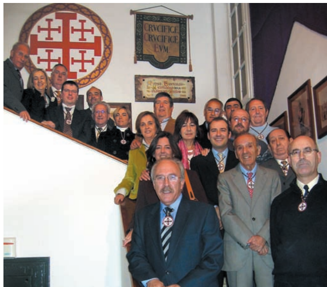
Junta de Gobierno 2005-2007

En este año en el que se celebra el Quinto Centenario del nacimiento de San Francisco Javier, pensemos que todos podemos ser misioneros como él, incluso sin salir