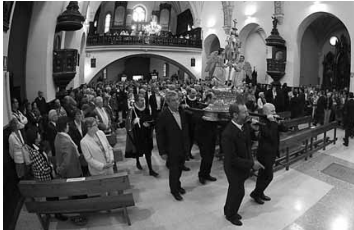
Decenas de fieles asistieron al voto de las Cinco Llagas en la iglesia de San Agustín.