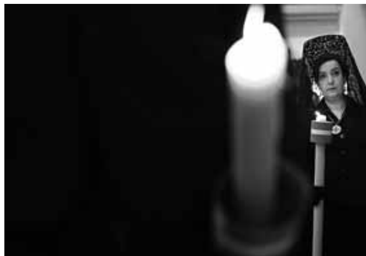
Estuvieron presentes miembros de la Hermandad de la Pasión. CORDOVILLA

mente, los maceros, el resto de la corporación y, cerrando la comitiva, la Policía Municipal con traje de gala.