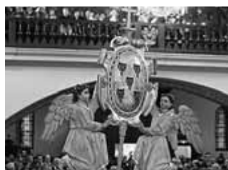
En la función de las Cinco Llagas.