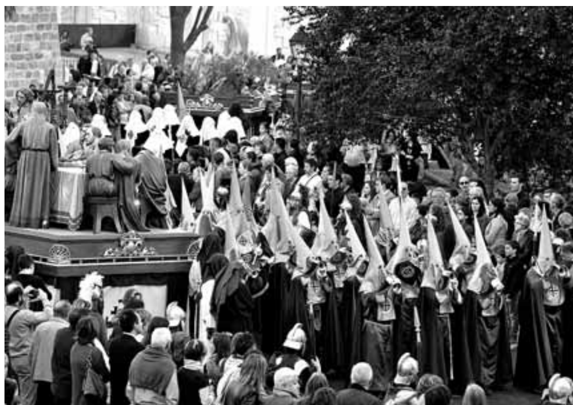
El paso de la Última Cena llega a la plaza de Santa María La Real junto a la banda de cornetas y tambores de la Hermandad de la Flagelación de Jesús de Logroño.

Los termómetros rondaban los veinte grados en la Plaza del Castillo. La salida prevista de la procesión era a las ocho de la tarde, pero minutos antes, decenas de soldados romanos organizados en distintos manípulos marcharon desde los locales de la Hermandad de la Pasión, en la calle Dormitalería, hasta la plaza del Arzobispado. Allí fueron tomando posiciones a lo largo de todo el recinto amurallado.